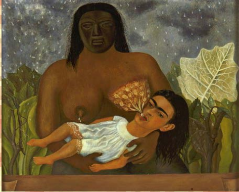
Mi Nana y yo