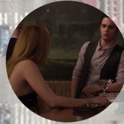
Oak Room, Plaza Hotel