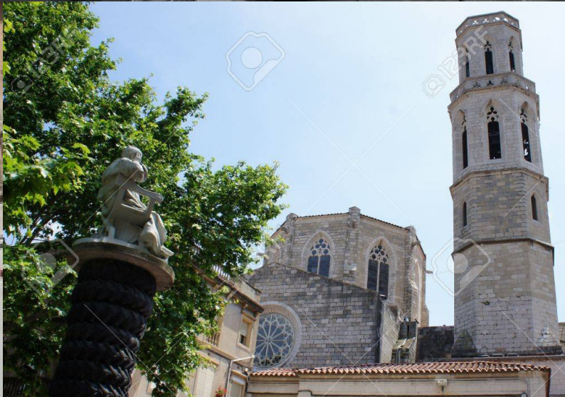
Iglesia de Sant Pere

Nació en la casa Puig, en el número 20 de la calle Monturiol. Fue un niño mimado, protegido hasta el exceso. Su tiranía infantil llegaba al punto de esconder heces por todos los rincones de la casa e incluso afirma que se orinó en la cama hasta los ocho años para humillar a su padre.