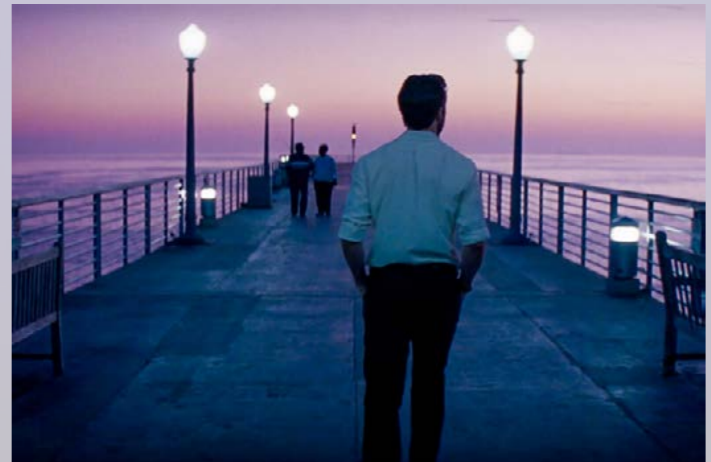
La escena más mítica de La La Land.