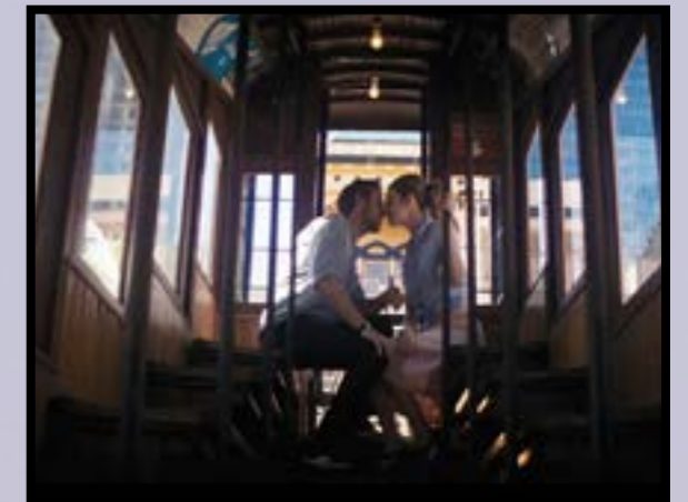
Angels Flight en La La Land.

Aunque la aparición en la película sea casi fugaz seguro que lo recuerdas ya que es en el momento donde Sebastian y Mia empiezan a conocerse y deciden dar un paseo por diferentes lugares de la ciudad.