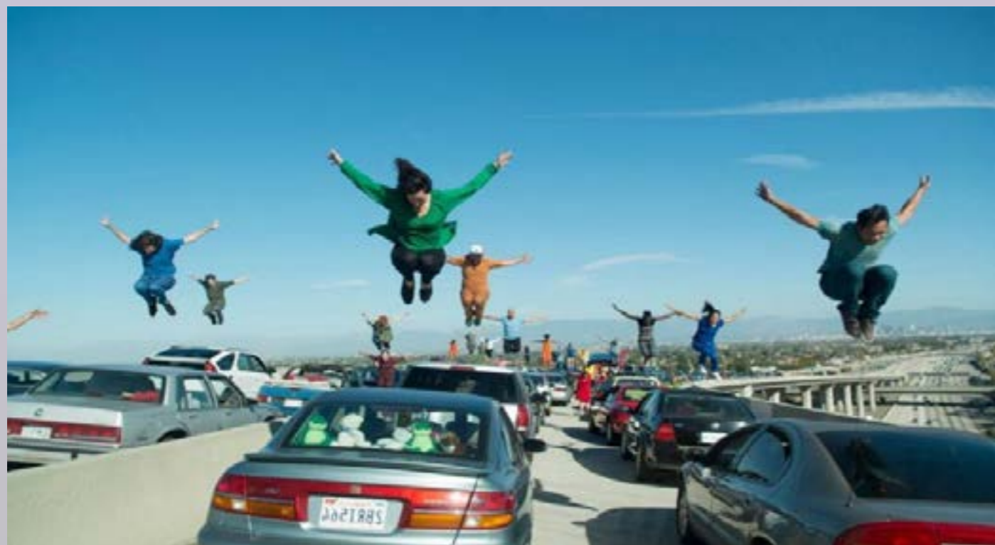
Escena de "Another day of sun".

Quizás no consigas ver el espectáculo que se forma en la película con centenares de bailarines dando saltos por sus vehículos, pero sí que conseguirás