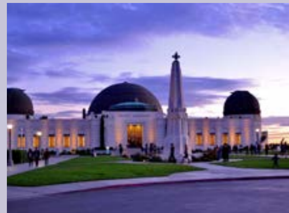
Griffith Observatory, un escenario elemental.

Pero antes de entrar en él, echa una ojeada a tu derecha para poder apreciar las tan famosas letras de Hollywood - la señal de 13 metros de altura en Lee Hill da la bienvenida a la ciudad de las estrellas desde hace aproximadamente un siglo. Si vas por la tarde tendrás unas preciosas vistas del mejor atardecer en la ciudad.