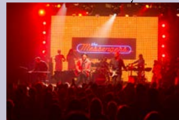
Concierto en la película.

Es ciertamente irónico que la canción signifique “comenzar un fuego” cuando realmente, en la película, esta canción lo que hace es apagar la llama entre Sebastian y Mia. La protagonista es consciente de que su compañero se ha vendido al pop y ha dejado de lado su sueño de abrir un local para estar en una banda, y por ello posteriormente le intentará inútilmente abrir los ojos.