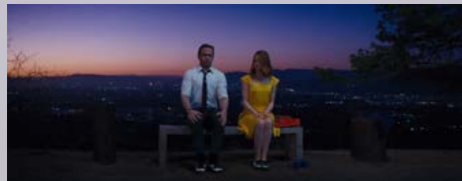
Vistas preciosas en Cathy's Corner.

Después de la fiesta de los 80, Mia y Sebastian van a buscar su coche y acaban tropezando con una maravillosa vista de la puesta de sol, desde un sitio privilegiado en la cima de una colina. Si quieres bailar con tu acompañante viendo la ciudad iluminada o simplemente respirar aire puro y descansar, debes visitar Cathy's Corner , que es donde se graba este mágico momento. Así que una vez hayas salido del Observatorio, coge el coche 20 minutos y dirígete hacia el norte, porque andando queda más lejos y es cuesta arriba. Ahí estará esperándote las maravillosas vistas.