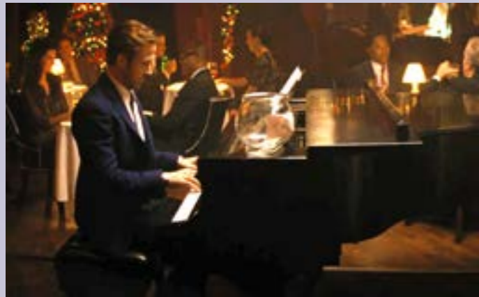
Ryan Gosling tocando el piano.

Como ya es la hora de comer, te proponemos ir al SmokeHouse Restaurant . En la película lo bautizan con el nombre de Lipton's y se trata ni más ni menos del restaurante donde Sebastian toca a regañadientes canciones de Navidad para J.K. Simmons. En este café se han grabado películas como Argo, Kidding, The Office, American Woman, Pure Genius, White Sheep, Best Thing I Ever Ate, entre otras. Además, este restaurante es un especialista en barbacoas y comida americana, aunque si en lugar de comer quieres ir a cenar en horario español... Te recomendamos que vayas pronto, ¡cierra a las 21:00h!