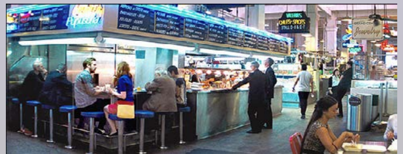
Los protagonistas en Grand Central Market.

Dentro del Grand Central Market, podrás elegir entre muchos bares o restaurantes pero debes saber que en el musical Mia y Sebastian eligen el Sarita's Puseria que es un local de especialidades salvadoreñas donde puedes degustar fideos artesanos, guisos y rellenos de todo tipo.