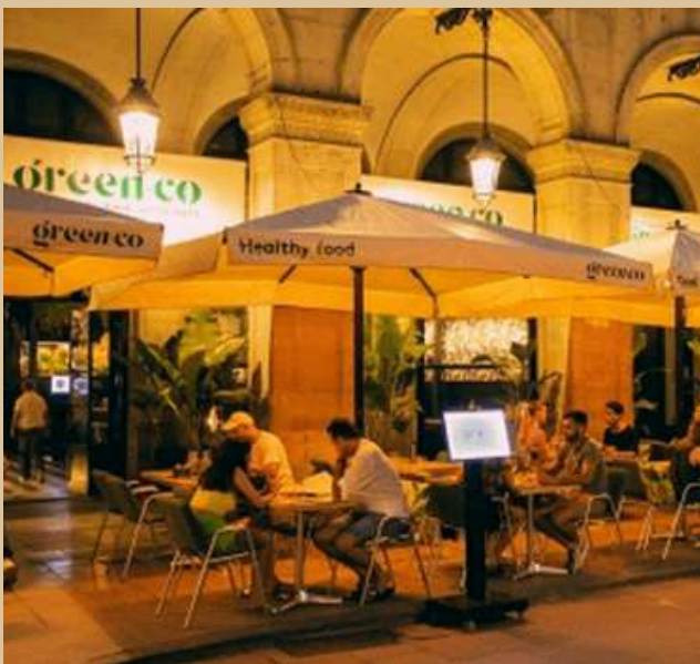
Plaça Reial, 8, 08002 Barcelona