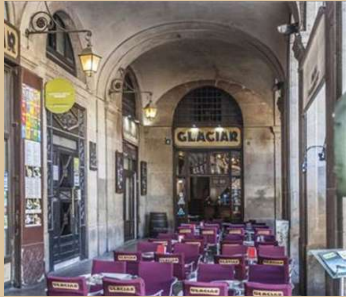
Plaça Reial, 3, 08002 Barcelona

Unes braves a la fresca? Una cervesa? Glaciar és un dels bars situats al cor de la mateixa Plaça Reial. A la seva carta trobareu un munt de tapes que us faran recarregar bateries per continuar estripant el que hi ha darrere del tresor de Magallanes. A més, podràs gaudir de la bellesa de la plaça. Glaciar és un dels bars més antics d'aquest espai, història viva de Barcelona!