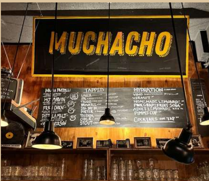
Passeig del Born, 29, 08003 Barcelona