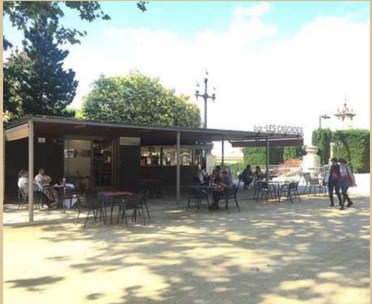
Plaça de les Cascades, s/n, 08038 Barcelona

Situat al cor de Montjuïc i tocant el Museu Nacional d'Art de Catalunya, el Bar les Cascades és ideal per passar una estona a la fresca, admirant la bellesa dels jardins que envolten la zona de Montjuïc i donar voltes al cap per trobar la solució de l'endevinalla. Si vas a l'estiu i un cop hagi marxat el sol, potser tens sort de veure la font de Montjuïc en acció!