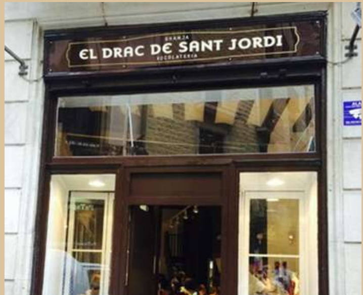
Plaça de Sant Josep Oriol, 3 08002 Barcelona

Amb vista a la Basílica de Santa Maria del Pi i al cor del Barri Gòtic de Barcelona, el Drac de Sant Jordi ofereix una selecció de pinxos i tapes per fer una paradeta. Compten amb un menú degustació que inclou crema catalana!