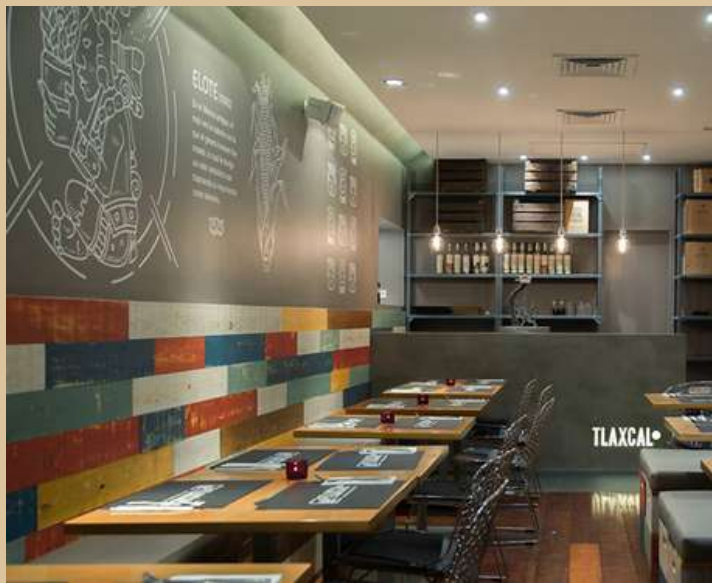
Carrer del Comerç, 27, 08003 Barcelona

Entre l'Estació de França i el Mercat del Born, en un carrer per als vianants, està Tlaxcal un restaurant especialitzat en menjar mexicà. Gaudeix dels millors tacos de la zona en un entorn tranquil i amb vista al teu pròxim destí. L'ambient de cantina i la proximitat al transport públic faran d'aquesta opció una de les més segures per gaudir d'un bon àpat.