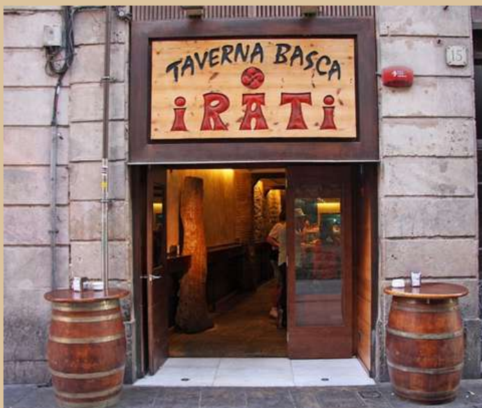
Carrer del Cardenal Casañas, 17, 08002 Barcelona

Pots traslladar-te fins a Euskadi sense anar gaire lluny de la Basílica de Santa Maria del Pi. Irati emula a la perfecció l'essència de les tavernes basques oferint no només els típics pinxos sinó també una selecció de plats inspirats en les terres del nord de la península. També té opcions vegetarianes per satisfer a tots els clients. No deixis que la fam aturi les teves ganes d'aventura!