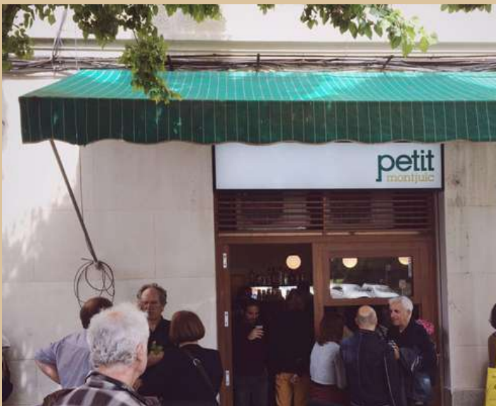
Carrer de Sant Isidre, 2, 08004 Barcelona